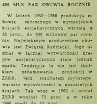
800 MLN PAR OBWIJĄ RÓCZNIE